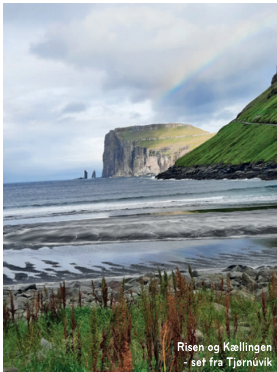
Risen og Kællingen - set fra Tjørnvík